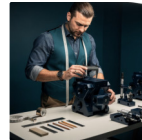
personalizzazione del servizio