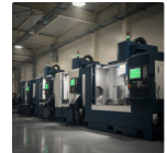
fermi non pianificati