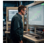
riduzione costi nel lungo periodo