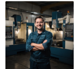
referente tecnico dedicato